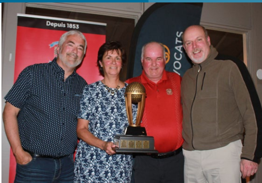
Les gagnants du trophée Financière Manuvie