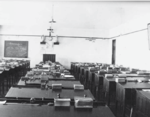
Salle d'études dans les années 1950