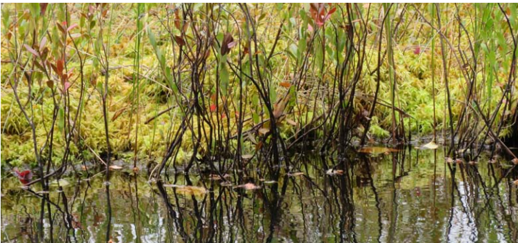
Les murmures du petit lac – photo promotionnelle

Du 16 mai au 9 juin 2019 au Centre d'exposition Louise-Carrier de Lévis, l'exposition L'empreinte des jours , photographies récentes de John R. Porter (1961-1968) . Le vernissage aura lieu en présence de l'artiste le jeudi 16 mai de 17 h à 19 h. Aussi, l'artiste animera une visite commentée le dimanche 2 juin à 14 h.