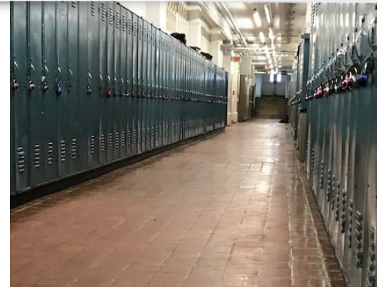
Corridor et vestiaires en 2019