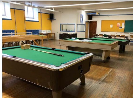
Salle de jeux de 3 e secondaire en 2019