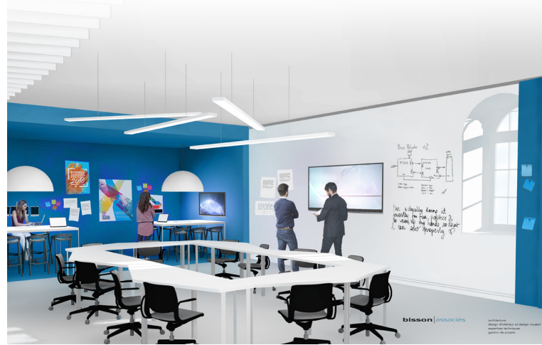
Nouvel environnement d'apprentissage au Collège de Lévis. Une des futures salles collaboratives

Une deuxième rencontre a eu lieu le 29 janvier dernier et confirma la vague provoquée par cette Campagne. Le Collège a besoin d'Anciens et d'Anciennes qui ont été heureux au Collège et qui veulent ardemment que ça se prolonge. Le bonheur, ça se propage et laissons à d'autres jeunes la chance de vivre le même plaisir que nous avons vécu. Vive la contagion. Dans les circonstances, c'est bénéfique!