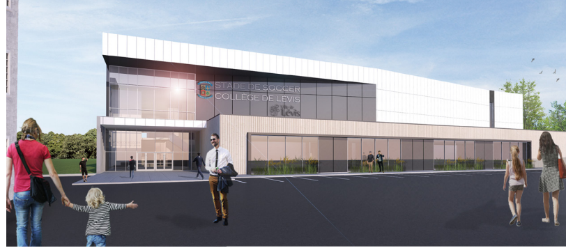
Le futur stade de soccer intérieur du collège sera installé dans la cour arrière, voisin de l'Hôtel-Dieu de Lévis

Nous pouvons affirmer haut et fort que le taux de participation obtenu confirme que les projets de la campagne majeure font consensus. Avec un taux de participation de 97 % à l'interne, voilà la preuve de l'impact positif qu'aura la réalisation des projets pour toute la communauté! Les résultats financiers de la communauté interne seront annoncés au printemps à l'ensemble des membres. Ces projets rassemblent et nous ressemblent.