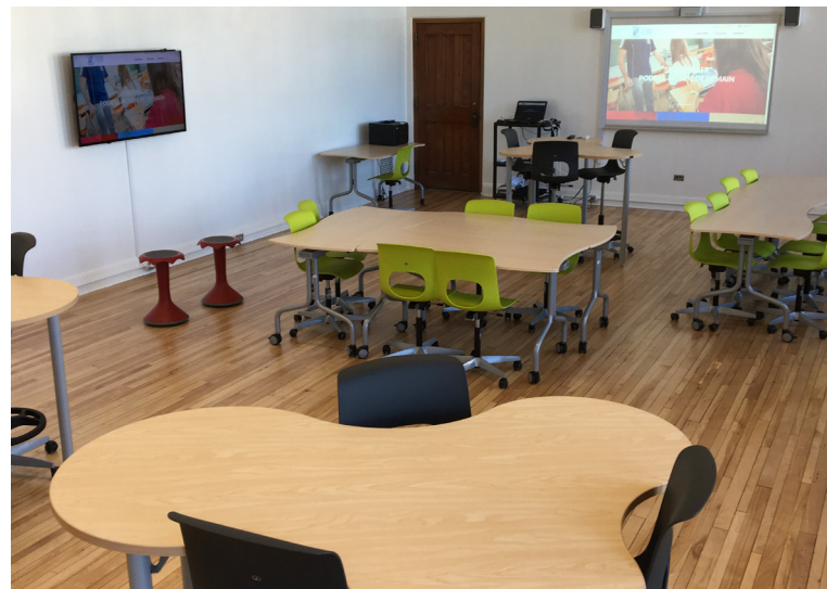
Nouvelle classe collaborative | septembre 2018