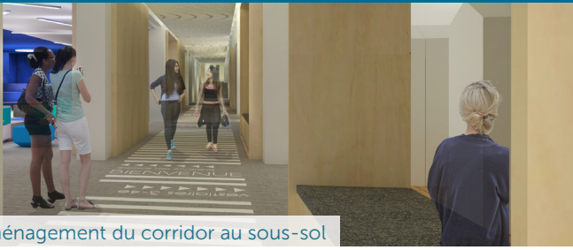
Le nouvel aménagement du corridor au sous-sol