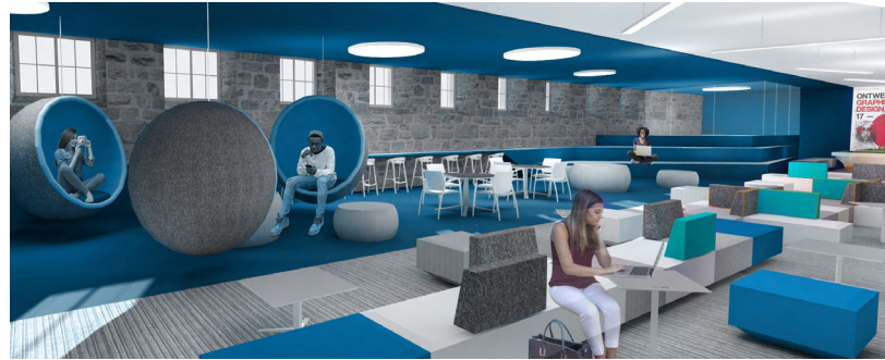
Nouvelle aire de vie étudiante au sous-sol de l'aile des classes

« Ensemble, avec notre alma mater , investissons dans la réussite et développons l'avenir! », affirment les coprésidents de la Campagne.