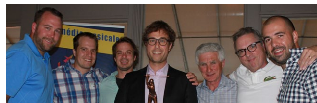
Les deux équipes gagnantes de la 24 e édition du Tournoi de golf de la Fondation (voir les noms des gagnants ci-dessous)