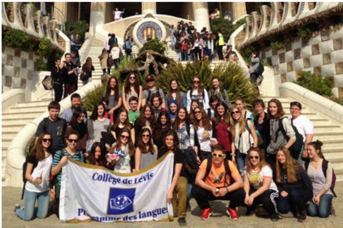
Le groupe heureux de cette belle expérience