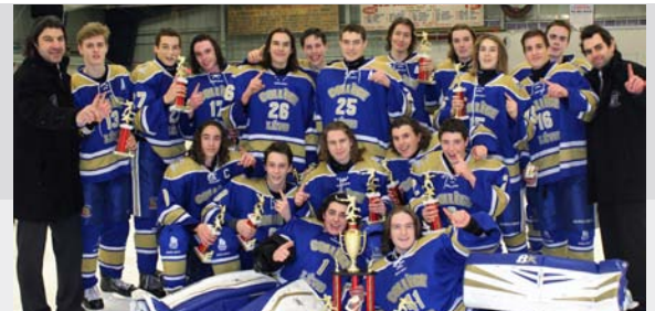
Le sourire de la victoire (M-17)