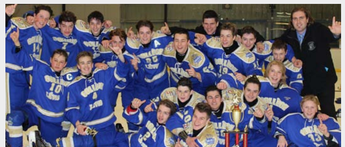
Des jeunes satisfaits de leur performance (M-15)