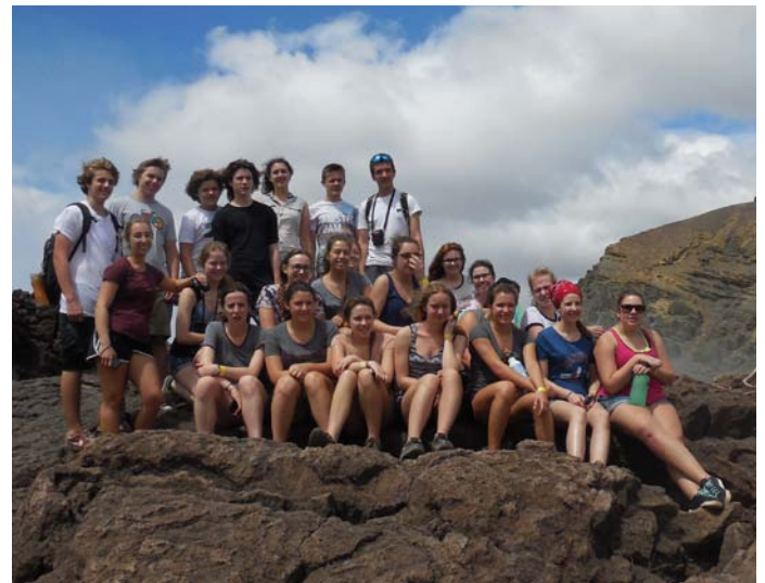
Un bel apprentissage communautaire formateur

24 élèves de 4 e et 5 e secondaires sont allés au Nicaragua en mars 2015 pour s'initier aux rudiments de la rencontre interculturelle et de la solidarité internationale. Ils ont pu pratiquer les valeurs de dépassement, d'ouverture aux autres et de don de soi.