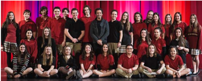
André Sauvé au centre du groupe d'élèves du foyer 305

L'humoriste André Sauvé était de passage au Collège en février 2015 dans le cadre des activités de financement pour le voyage en Europe des élèves de 3 e secondaire du programme de langues. D'ailleurs le groupe nous est revenu le 13 mars après avoir vécu un périple de 10 jours à Paris, Londres et Barcelone.