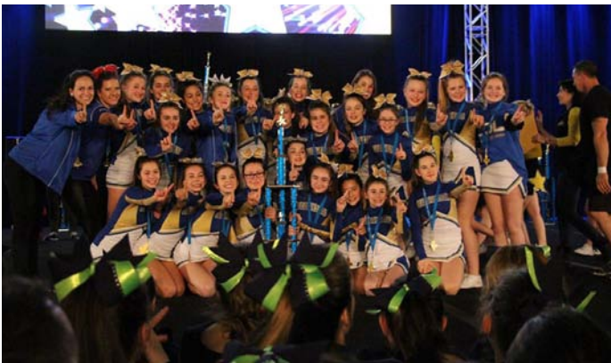
Des cheerleaders performantes et fières