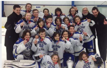
La fin d'un voyage fructueux (M-13)