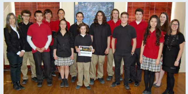
Lauréats et lauréates de ce concours en entrepreneurship Face aux Dragons