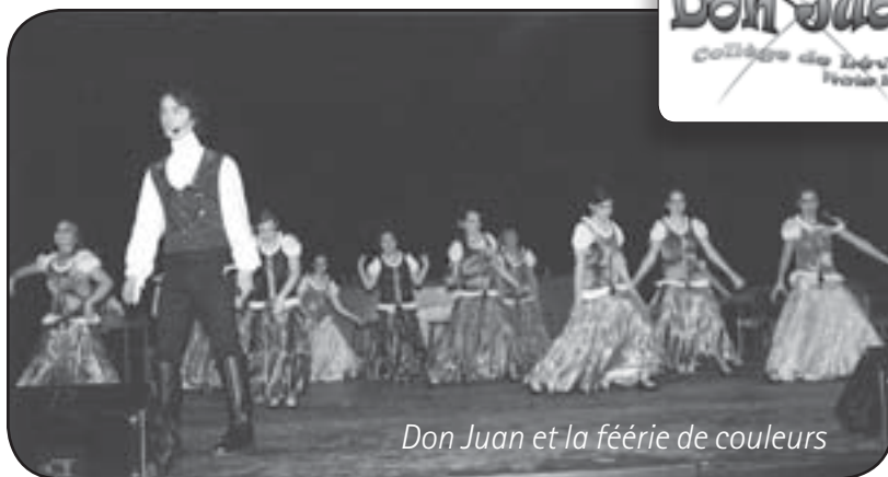
Don Juan et la féerie de couleurs

Préparer un spectacle au Collège, voilà une expérience presque aussi vieille que l'institution elle-même. Déjà vers 1870, les professeurs de l'époque avaient le goût de lancer les jeunes étudiants sur la scène fort rudimentaire de l'époque. Costumes, fausses barbes, maquillage et surtout le défi de se dépasser animaient ces jeunes guidés par leurs maîtres. Depuis ces débuts déjà populaires