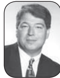
Le Président, Jean Lapointe, C.A.