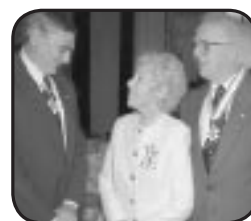
Roméo Leblanc, gouverneur général, Pierrette Alarie, soprano et Léopold Simoneau, ténor.

Vis-À-Vis Marketing et communications - (418) 839-5880 Pour alléger la lecture du texte, le genre masculin a été retenu.